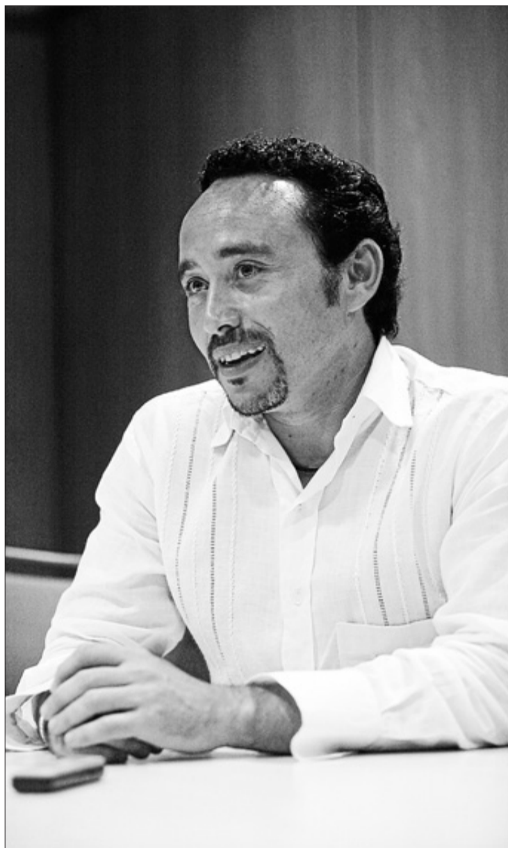
Marí durante la entrevista. L. P.

—En Haití hay una comunidad internacional muy importante y de España se habla mucho, con sorpresa. La gente quiere entender cómo un país que ha sido un ejemplo de desarrollo vertiginoso está viviendo un momento tan negativo. Te informas de tu país a distancia y no hay manera de que te llegue algo positivo y, cuando he llegado a España, tanto en Madrid como en Eivissa, hay un desánimo generalizado. Eso en Latinoamérica sorprende mucho. Las crisis son grandes oportunidades y nosotros no estamos viendo dónde está la oportunidad. Martelly tiene un país sumido en la pobreza y ha decidido cambiarlo. ¿Dónde estamos nosotros? No somos un país tercermundista, somos un país rico. Sí, estamos en crisis, vale. Pero ¿dónde están los